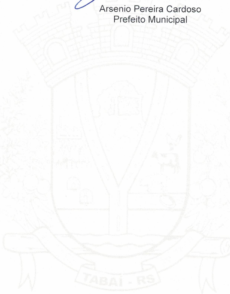
Arsenio Pereira Cardoso Prefeito Municipal

Gabinete do Prefeito Municipal de Tabai, 04 de fevereiro de 2021.