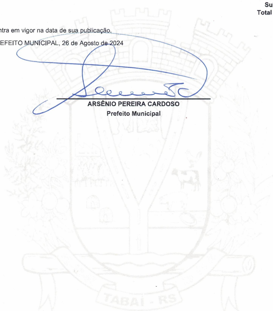
ARSÊNIO PEREIRA CARDOSO Prefeito Municipal

GABINETE DO PREFEITO MUNICIPAL, 26 de Agosto de 2024