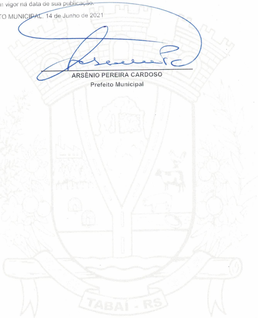
ARSÊNIO PEREIRA CARDOSO Prefeito Municipal