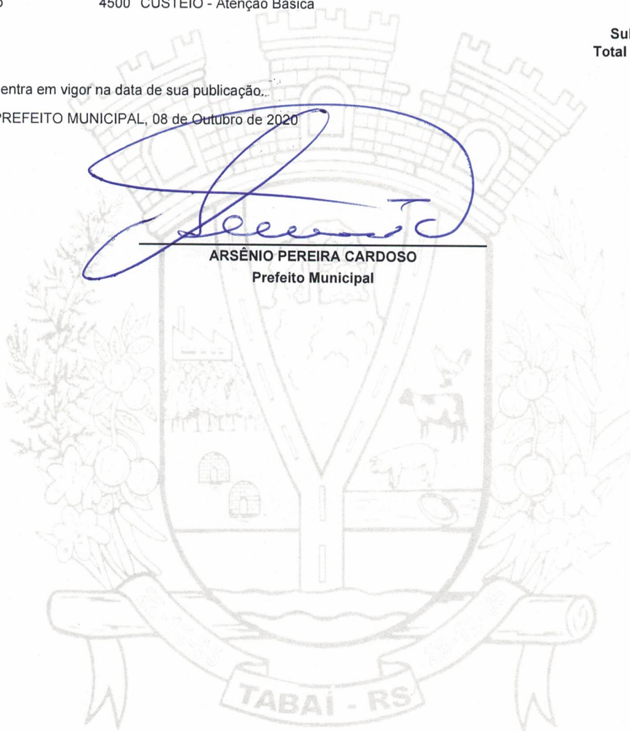
ARSÊNIO PEREIRA CARDOSO Prefeito Municipal