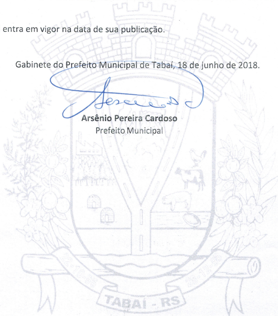
Arsênio Pereira Cardoso Prefeito Municipal

Gabinete do Prefeito Municipal de Tabai, 18 de junho de 2018.